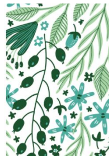
BEATRICE PTAK NATUROPATE HILDESARDIEN CERTIFIE